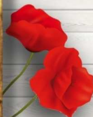
Vespa Club Chiari